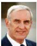
Mag. Wolfgang Sobotka

Mit dem NÖ Wohnbaumodell haben wir ein Förderinstrument entwickelt, das beinahe so facettenreich ist wie das Leben der Menschen selbst. Von der ersten eigenen Wohnung bis hin zur Förderung von Umbaumaßnahmen, damit das Eigenheim den Bedürfnissen älterer Menschen gerecht wird, bieten wir mit der niederösterreichischen Wohnbauförderung Unterstützung in allen Lebenslagen. Mit dem NÖ Wohnbaumodell machen wir deutlich, worum es uns in der Wohnbaupolitik geht: Wir denken an das Zuhause, das wir heute für unsere Familien schaffen. Und an die Welt, die wir unseren Kindern hinterlassen.